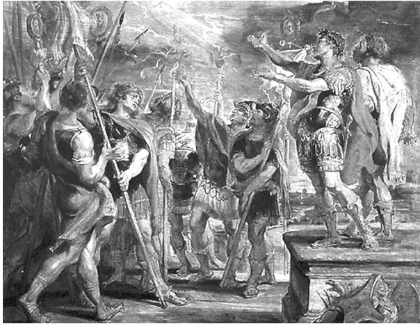
(Рубенс. Видение императору Константину)