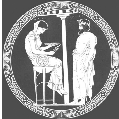
(Изображение Пифии на краснофигурном килике)