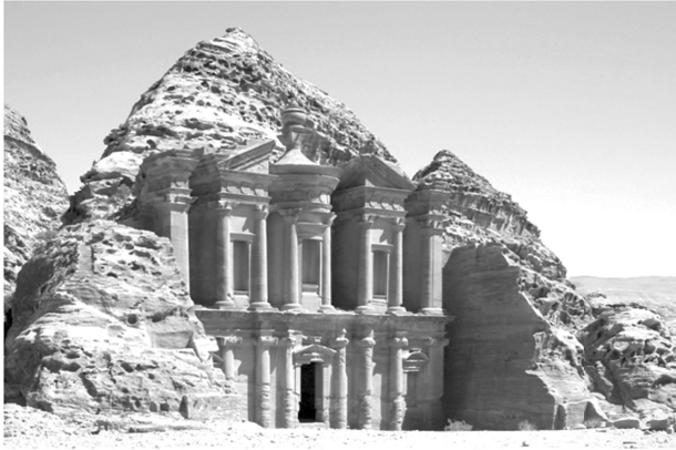
(Петра, столица Nabateu)