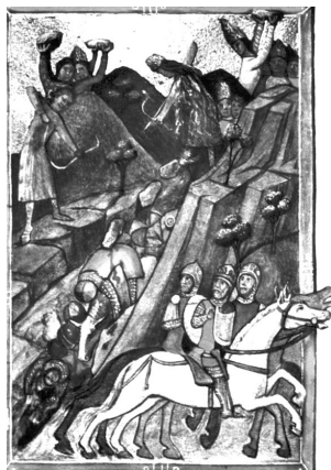
(Битва при Посаде, 9–12 ноября 1330 г.)