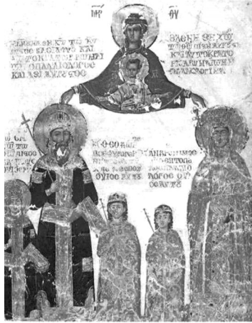
(Император Мануил II и его семья)