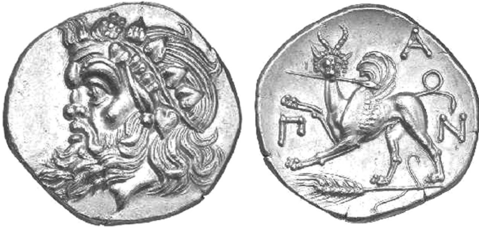
(Золотой статер Перисада I)