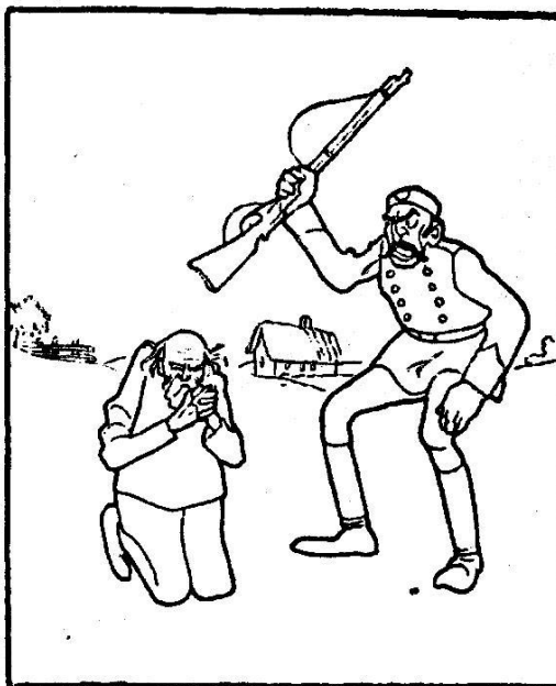
Болгары въ Сербii.