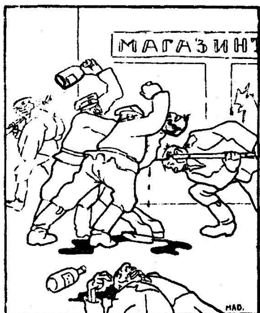
Русскіе въ Россii.

Розгляньте карикатуру та виконайте наступні завдання: