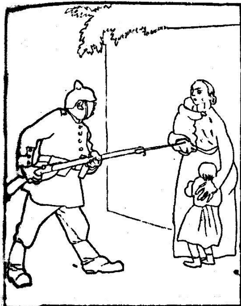
Германцы въ Бельгii.