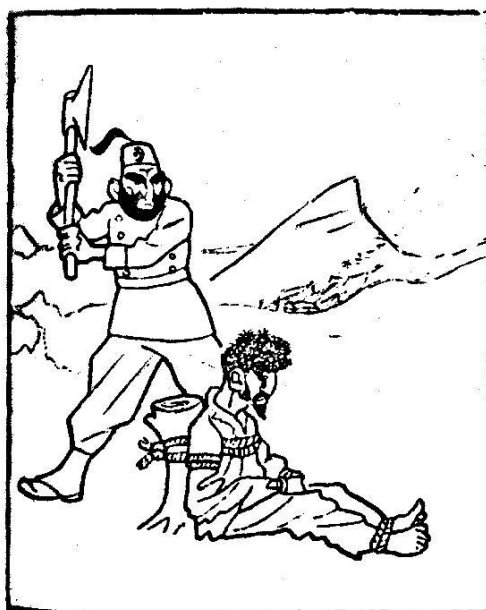
Турки въ Арменii.